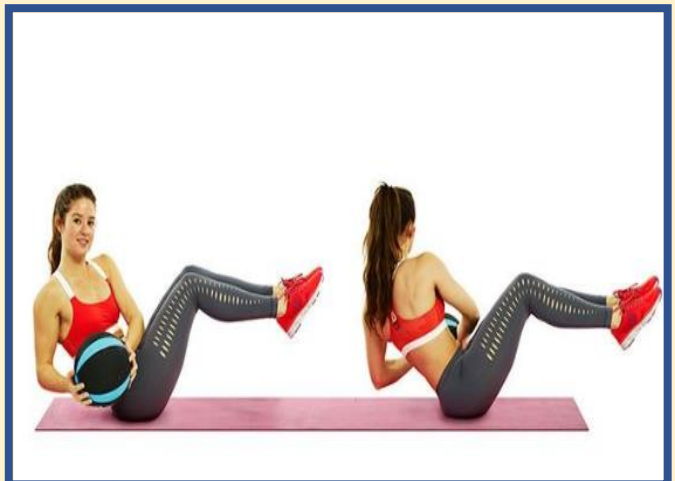
RUSSIAN TWIST (20 GIROS)