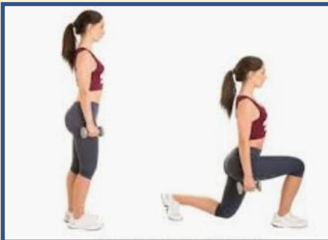
12 LUNGES (6 CON CADA PIERNA)

NOTA IMPORTANTE: en caso de que la ejecución no sea la adecuada debido al cansancio debemos parar la serie hasta que seamos capaces de volver a ejecutar correctamente el ejercicio.