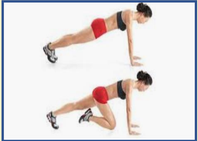
20 APOYOS ESCALADOR (10 POR PIERNA)